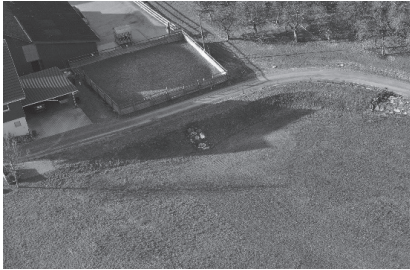
Buchackern, Rückhaltebecken Scheewis

Rückblickend auf 2023 konnten nachfolgende grössere Investitionen abgeschlossen werden: